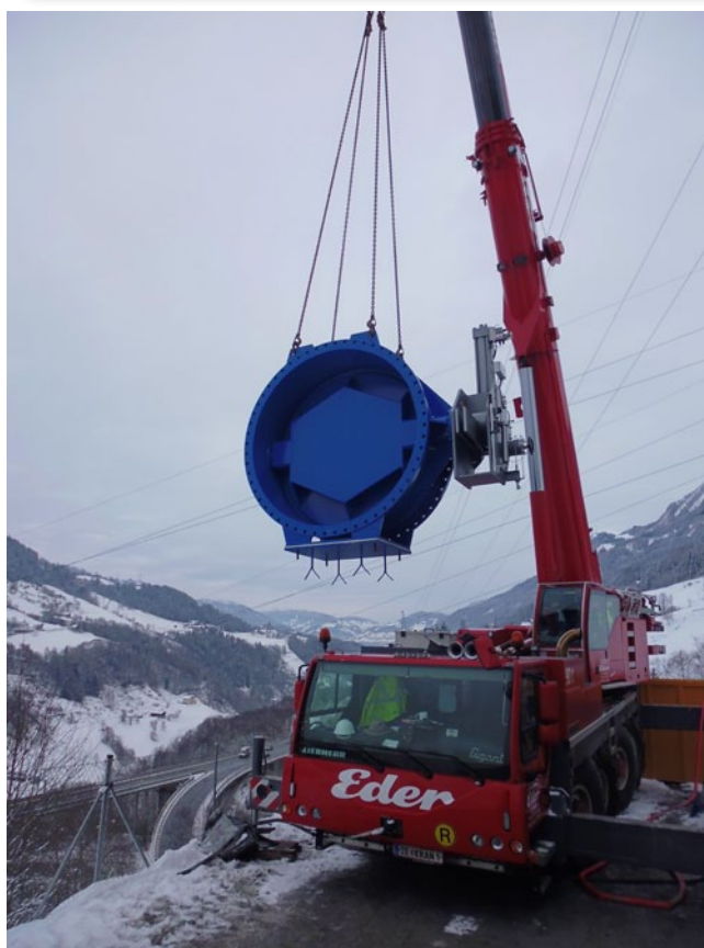
Перевозка Поворотного затвора VAG EKN®